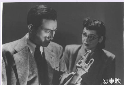
映像化第一弾！ “完全無欠のヒーロー”金田一