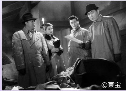
クールで知的な“都会派”金田一 ファッションモデルと豪華共演！