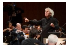
「ラトル&ベルリン・フィル」ルツェルン音楽祭2015

※「クラシック大全第2章」とは…2016年5月~2017年3月の年間編成テーマ。「オーケストラ」、「オペラ」、「バレエ」、「弦楽」、「ドキュメント」の5つの切口で番組を編成。クラシック音楽の定番である名曲を編成してきた「クラシック大全第1章」に対し、第2章では“人と歴史”という視点も新たに加えて編成。