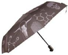
折り畳み傘/ Bk Sherlock Icons F 8,532円 (税込)