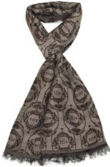
スカーフ/ Sherlock Scarf Gray 8,856円 (税込)