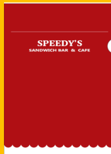
クリアファイル/SPEEDY'S (2枚セット) 972円（税込）