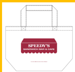
トートバッグ/SPEEDY'S (S) 1,944円（税込）