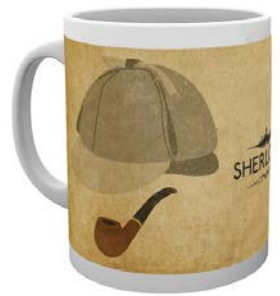
マグカップ/ Sherlock Victorian 3,996円 (税込)