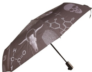
折り畳み傘/Bk Sherlock loons F