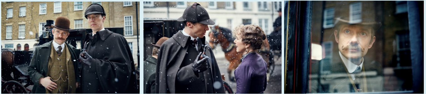
©2015 Hartswood Films Ltd. A Hartswood Films production for BBC Wales co-produced by Masterpiece. Distributed by BBC Worldwide Ltd.