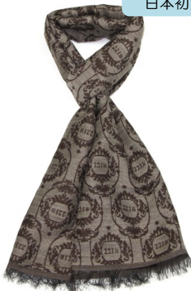
スカーフ/Sherlock Scarf Gray